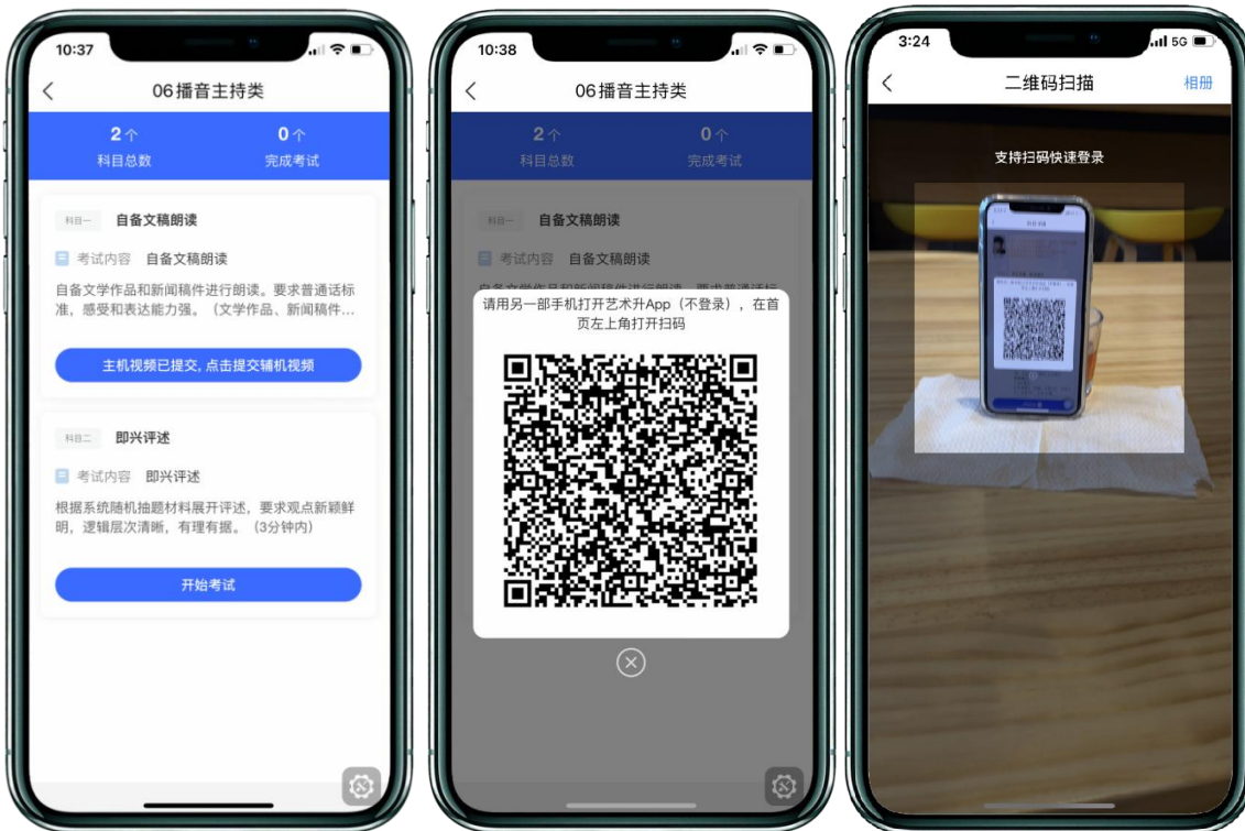
(主机上传视频成功后辅机扫码页面)