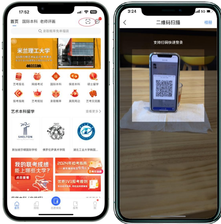
(打开辅机[手机B]进行扫码)

主机（手机A）这个时候会要求考生进行实人认证，请考生按照提示进行操作，通过验证后可以开始视频拍摄。