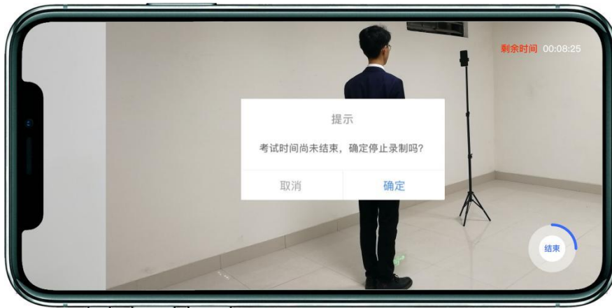
(辅机[手机B]视频录制)