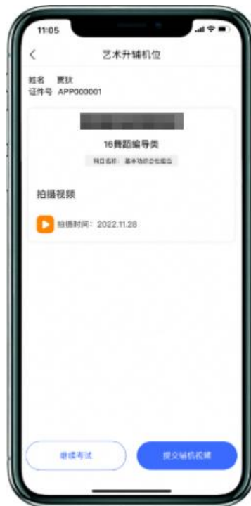
(辅机[手机B]视频录制)